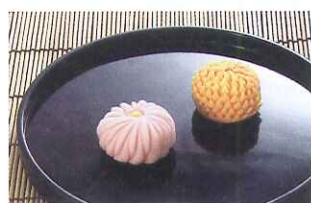
金沢和菓子(かなざわがし)

1980年石川県生まれ。金沢兼六園下に明治14年(1881年)から続く老舗の4代目。大学卒業後にこの世界に入り、父の急逝に伴い代を継ぐ。名門、星稜高校の野球部出身で甲子園にも出場した。