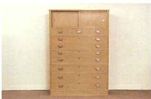
加茂桐たんす (かもきりたんす)

1984年新潟県生まれ。エンジニアを目指して早稲田大学理工学部で機械工学を専攻するが、木工の道に進むために卒業を目前に中退。その後職業訓練校を経て、現在は加茂市内のたんす店で研鑽を積む。