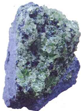
ケイ酸マグネシウムが主成分のかんらん石。半貴石ペリドットのもとになる鉱物で緑色をしている