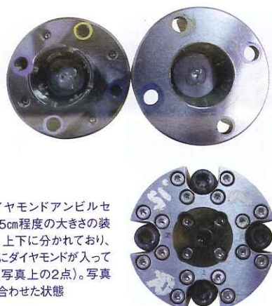
「ダイヤモンドアンビルセル」。5cm程度の大きさの装置で、上下に分かれており、中心にダイヤモンドが入っている(写真上の2点)。写真下が合わせた状態

常に難しいのです。こうした手法自体は1960年代に開発されたもので、私が実験を始めた96年の段階です。すでに100万気圧程度の高压環境をつくることはできました。でも、同時に高温にするのは簡単ではありませんでした。というのも、レーザーで高温にしたときに、力のバランスが崩れて加熱した瞬間にパインと割れてしまうので……。結局、120万気圧と2500度の高压高温を発生し、さらにケイ酸マグネシウムの状態を最初に観察したのは02年のことでした。 ——あと少しが、本当に難しいものなのですね。その後、10年ほど経っていますが、今はどのくらいまで到達しているのですか？