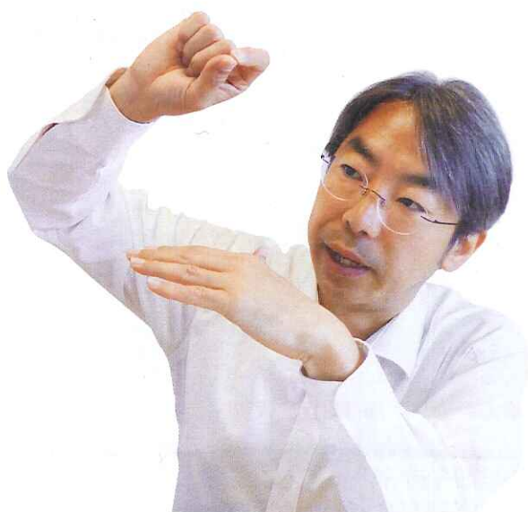
東京工業大学地球生命研究所所長・教授