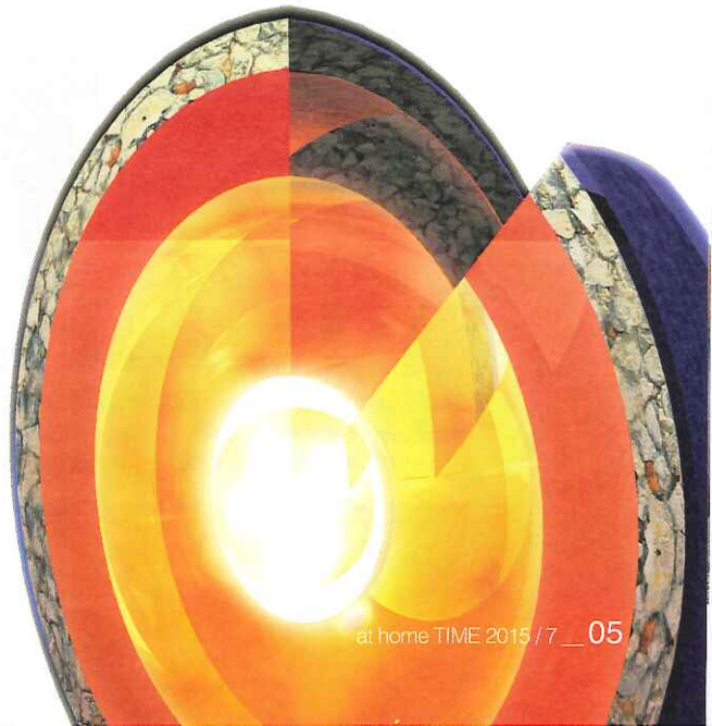
地震波の観測結果から、この図のような地殻、マントル、コアといった大雑把な同心円状のたまねぎ型の構造がわかる