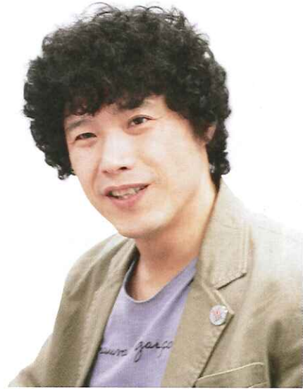
広島大学大学院生物圏科学研究科准教授