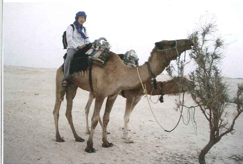
アフリカ大陸北部に広がる世界最大の砂漠「サハラ砂漠」での様子