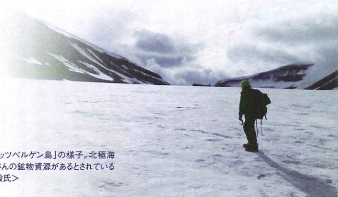
北極圏にある「スピッツベルゲン島」の様子。北極海の氷の下には、たくさんの鉱物資源があるとされている

先生のご研究を通じて、人々が人間の本来のあり方を自覚することになれば、戦争などの暴力防止にもなると思います。 さらなるご活躍を期待しています。本日はありがとうございました。